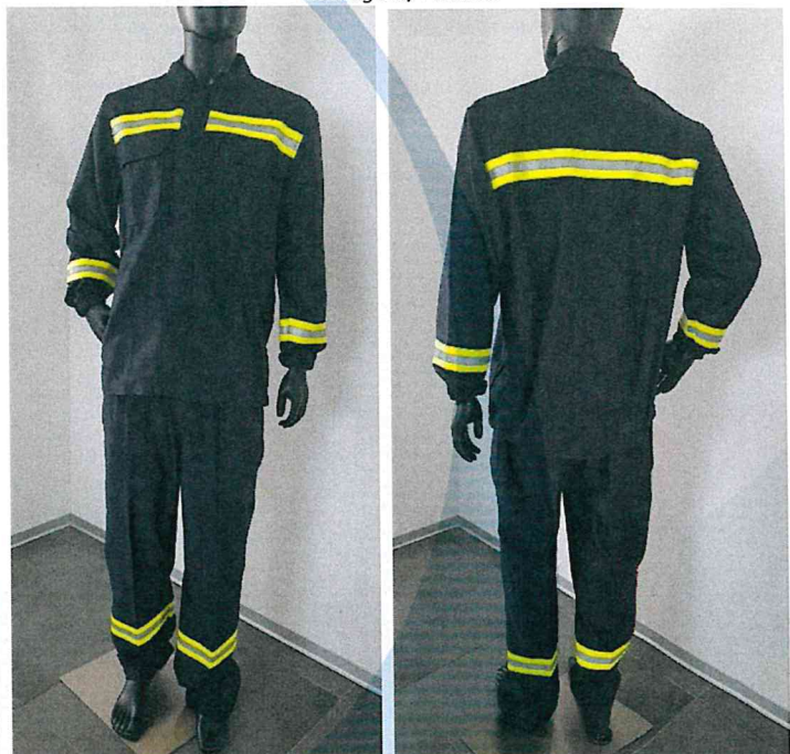
Immagine / Pictures

As the base model without reflective tapes .